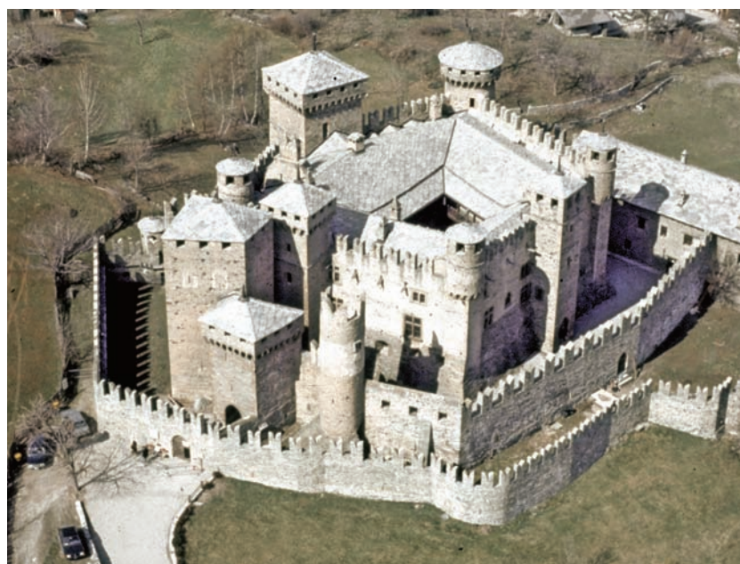
1. Vue du château. (L'Image)

- la "vieille tour" située à l'Ouest de l'entrée se superpose avec son angle Nord-Ouest à une section de l'enceinte intermédiaire qui se développe à partir de cet angle. Quelques bois de la tour ont été datés avec l'analyse dendrochronologique à 1235, période qui remonte à des travaux de construction de la première phase du château. D'autres analyses sur des éléments de bois, qui ont fourni des dates aux alentours de 1897, nous confirment au contraire la période à laquelle furent effectuées les restaurations.