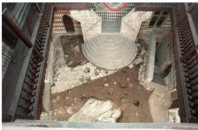
2. Vue générale de la cour une fois les fouilles complétées. (S.E. Zanelli)